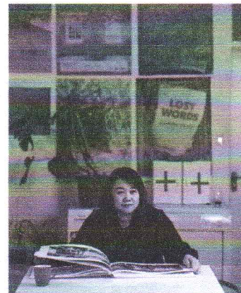
Chiharu Shiota Berlin, 2023

SHIOTA Chiharu is a Berlin-based artist who is active internationally and who creates works that explore the fundamental theme of “life and death.” A work she made while studying in Germany in 1997, which employed her own body as a component of the work, marked her starting point as an artist. As exemplified by works such as “Memories of Skin,” a work composed of gigantic dresses coated in mud that she presented at the Yokohama Triennale in 2001, and “During Sleep,” a work involving 30 beds that she showed at Switzerland’s Museum of Art Lucerne in 2002, Shiota’s works hint at “life and death,” and as such they have been greeted with astonishment by large numbers of viewers. Shiota continues to show a large number of her distinctive works in countries around the world, and in particular “The Key in the Hand,” a work in which tens of thousands of keys were connected with a mass of red threads, which she presented at the International Art Exhibition – La Biennale di Venezia, won high praise for carrying a powerful visual impact and unifying the wishes or memories of people. Shiota’s activities put international exchange into practice, and she has also emerged as a driving force encouraging women to flourish internationally. Against the backdrop of this extensive and remarkable track record, we expect Shiota to continue to make great strides in the future also, and accordingly, we believe she is a worthy recipient of the Japan Foundation Award.